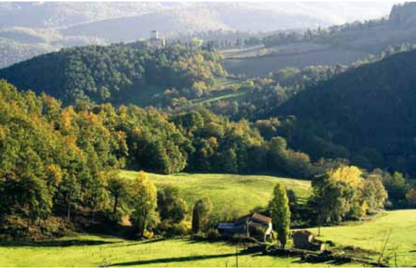
Anghiari, ai limiti della Riserva Naturale dei Monti Rognosi

Probably of Etruscan origin, this small mountain centre buddles around the Romanesque church of San Pancrazio. The Antiquarium Nazionale museum preserves the archaeological remains attesting to the town's ancient origin.