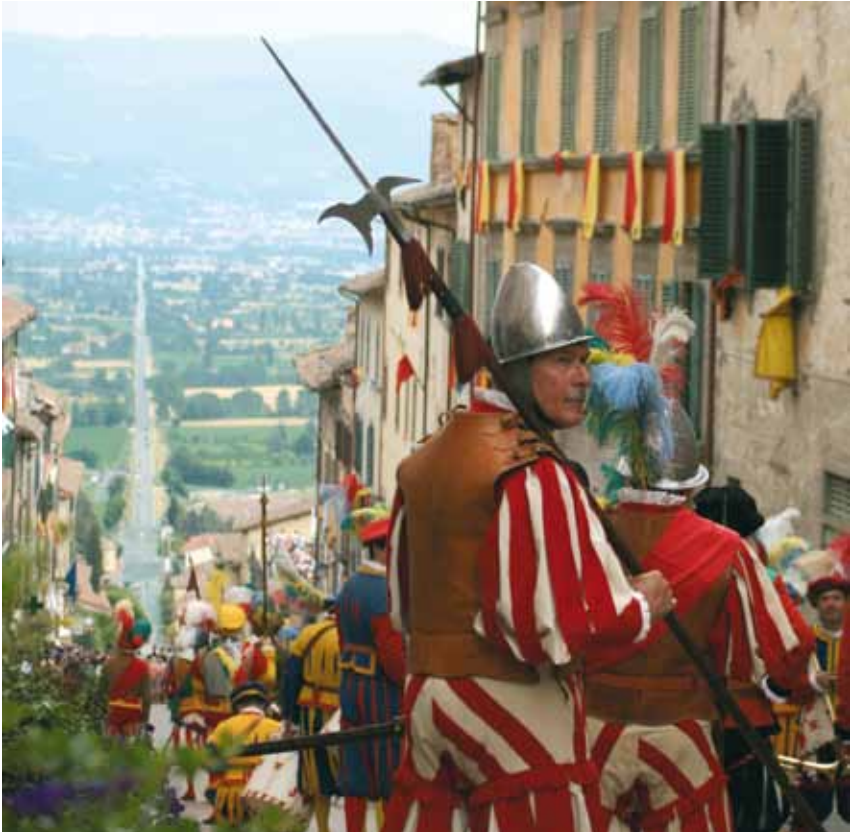
Anghiari, 29 Giugno, Palio della Vittoria

MUSEO STATALE DI PALAZZO TAGLIESCHI Piazza Mameli, 16 tel. 0575 788001 PALAZZO DELLA BATTAGLIA MUSEO DELLE MEMORIE E DEL PAESAGGIO NELLA TERRA DI ANGIARI Piazza Mameli, 1/2 tel. 0575 787023 MUSEO DELLA MISERICORDIA Via F. Nenci, 7 tel. 0575 789577 CHIESA DI SANTA MARIA DELLE GRAZIE PROPOSITURA Via della Propositura, 4 tel. 0575 788041 CHIESA DI SANT'AGOSTINO Via Garibaldi tel. 0575 787023 CHIESA DI BADIA Piazzetta della Badia